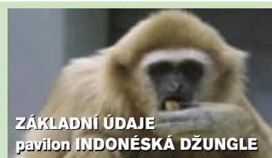
ZÁKLADNÍ ÚDAJE pavilon INDONÉSKÁ DŽUNGLE

Vytápění a větrání pavilonu je zajištěno nuceným oběhem vzduchu pomocí vzduchotechniky. Pro případ jejího výpadku je kupole opatřena řadou otevíracích světlíků. V nosné konstrukci je vedena část vytápění a závlahy včetně pravidelného mlžení a tropického deště. V expoziční části bude udržována stálá teplota 25-28 stupňů C a vzdušná vlhkost 70-90 procent.