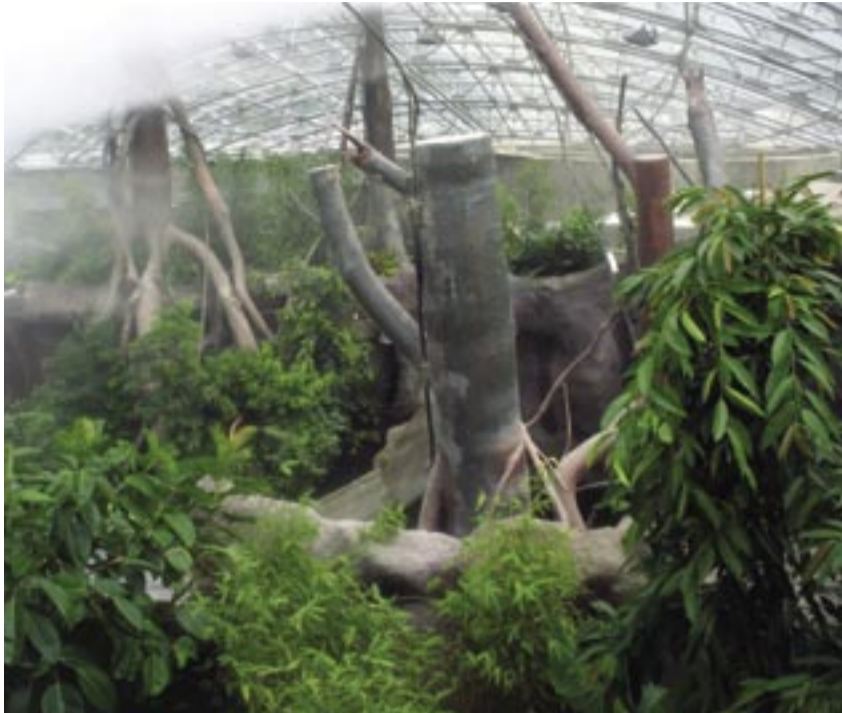
Pohled do pavilonu Indonéské džungle.

Expoziční prostor pavilonu má imitovat dobrodružnou výpravu džunglí. Je bohatě členěn horizontálně i vertikálně. Jsou zde úzké pěšiny s průhledy do džungle, jes-