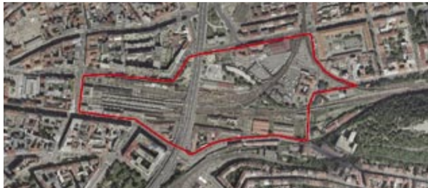
Současný stav, letecký snímek

i terminálu MHD. Jde tedy o úvahy, jak udělat ze současného železničního uzlu moderní evropské nádraží a zajistit jednotné odbavování cestujících z mezinárodních vlaků a z letiště. Já si myslím, že je to příležitost přímo generační, protože po sto padesáti letech se tady ta možnost otevírá a my jí nesmíme promarnit. Musíme pečlivě promyslet všechny aspekty těchto problémů. Protože pokud se rozhodneme špatně, tak je na dalších sto let zase zakonzervováno. A právě proto je ta stavební uzáveřa, aby se jednotlivou stavební činností nepokazily