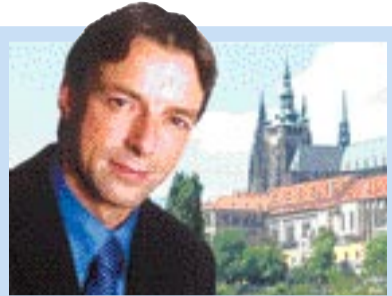
MUDr. PAVEL BÉM Primátor hlavního města Prahy

Nedávno se mne jedna novinářka ptala, co všechno se podle mne v našem hlavním městě změnilo od 17. listopadu 1989. Marně jsem hledal stručnou odpověď. Změnilo se totiž úplně vše.