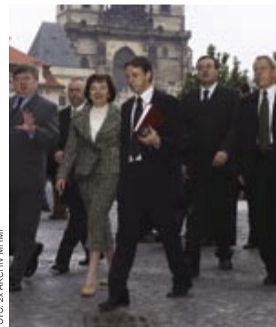
První dáma České republiky paní Livie Klausová s primátorem MUDr. Pavlem Bémem na Staroměstském náměstí.

30. 9. 2003 a jejím výtěžkem je 907 635,91 PLN. Obnos byl rozdělen mezi Dům dětí a mládeže hl. m. Prahy v Karlíně a Ústav sociální péče v Terezíně. Dům dětí a mlá-