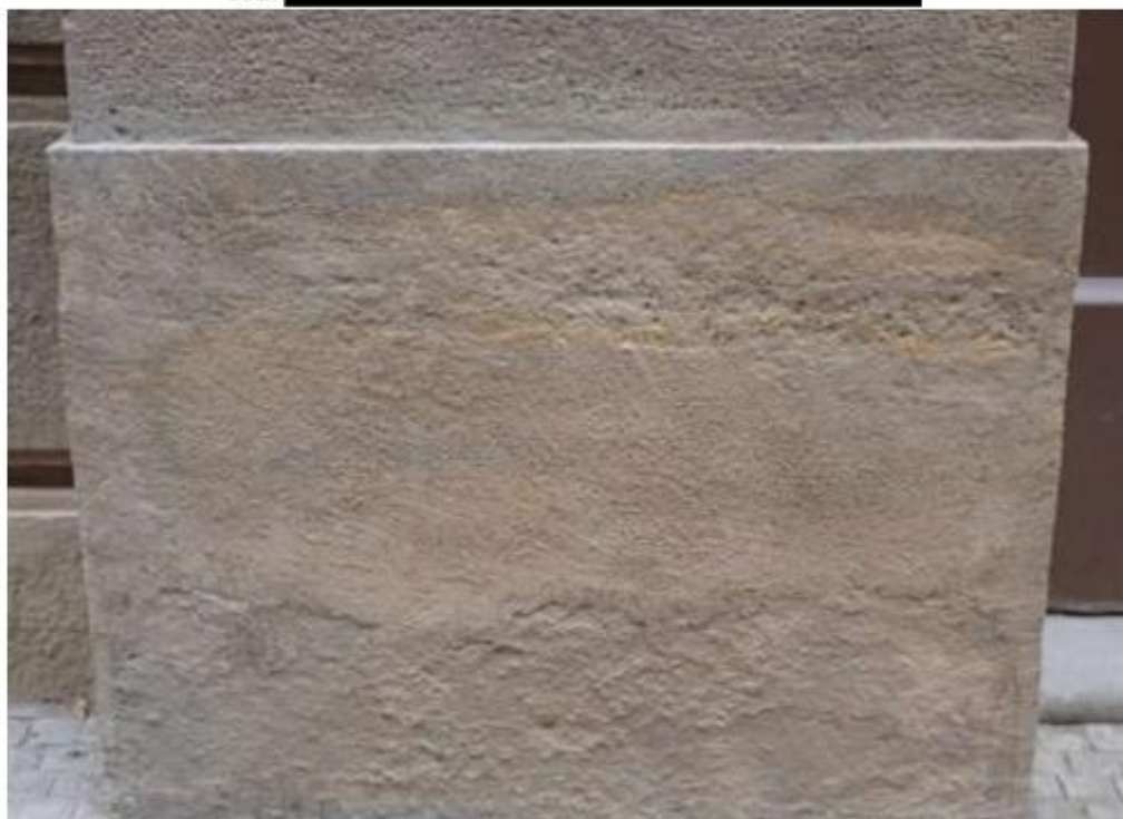
Úprava struktury doplňného umělého kamene v soklové části vstupního portálu.