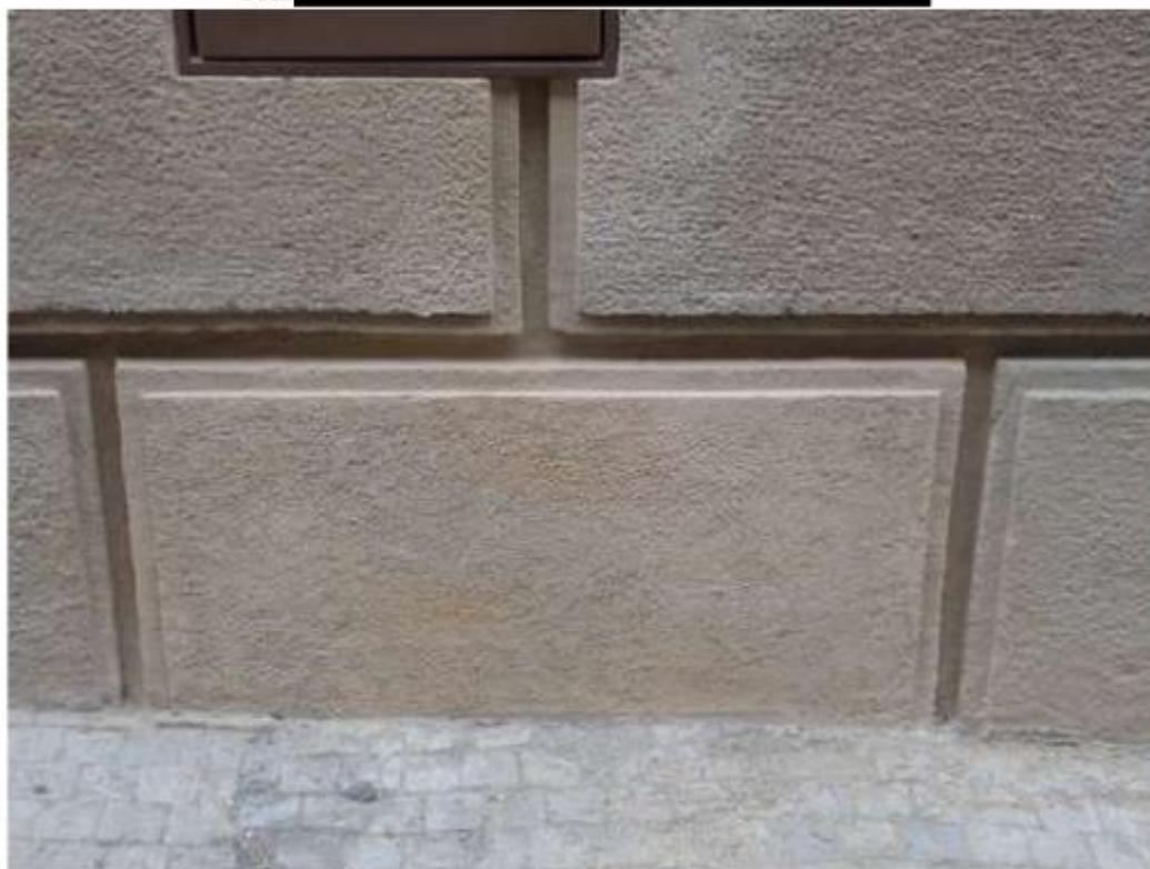
Doplnění bosáže umělým kamenem bez původní úpravy pemrlováním.