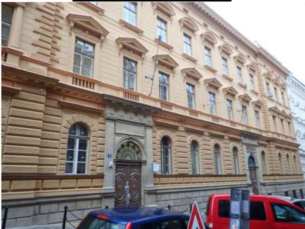
Celkový pohled na uliční fasádu po obnově.