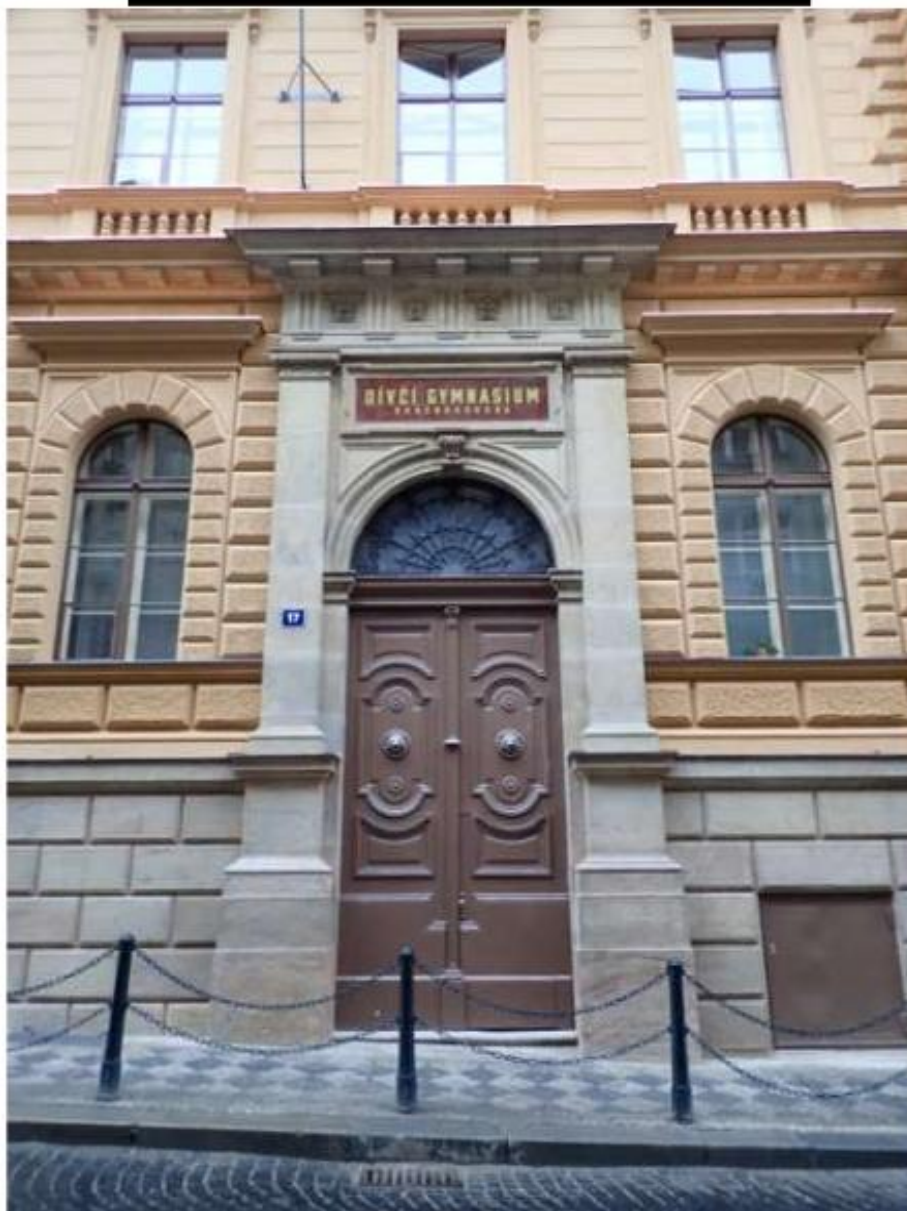
Vstupní portál po obnově ( v pravé části ).