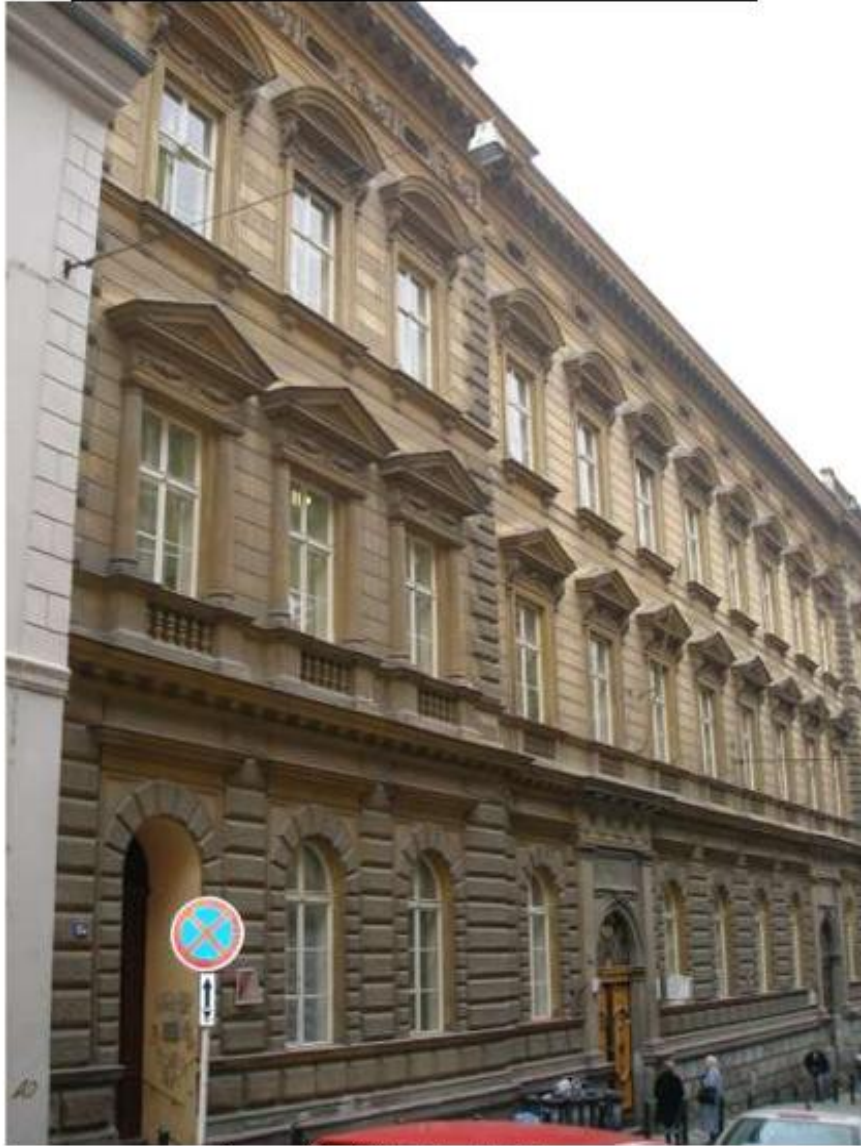
Stav uliční fasády před obnovou.