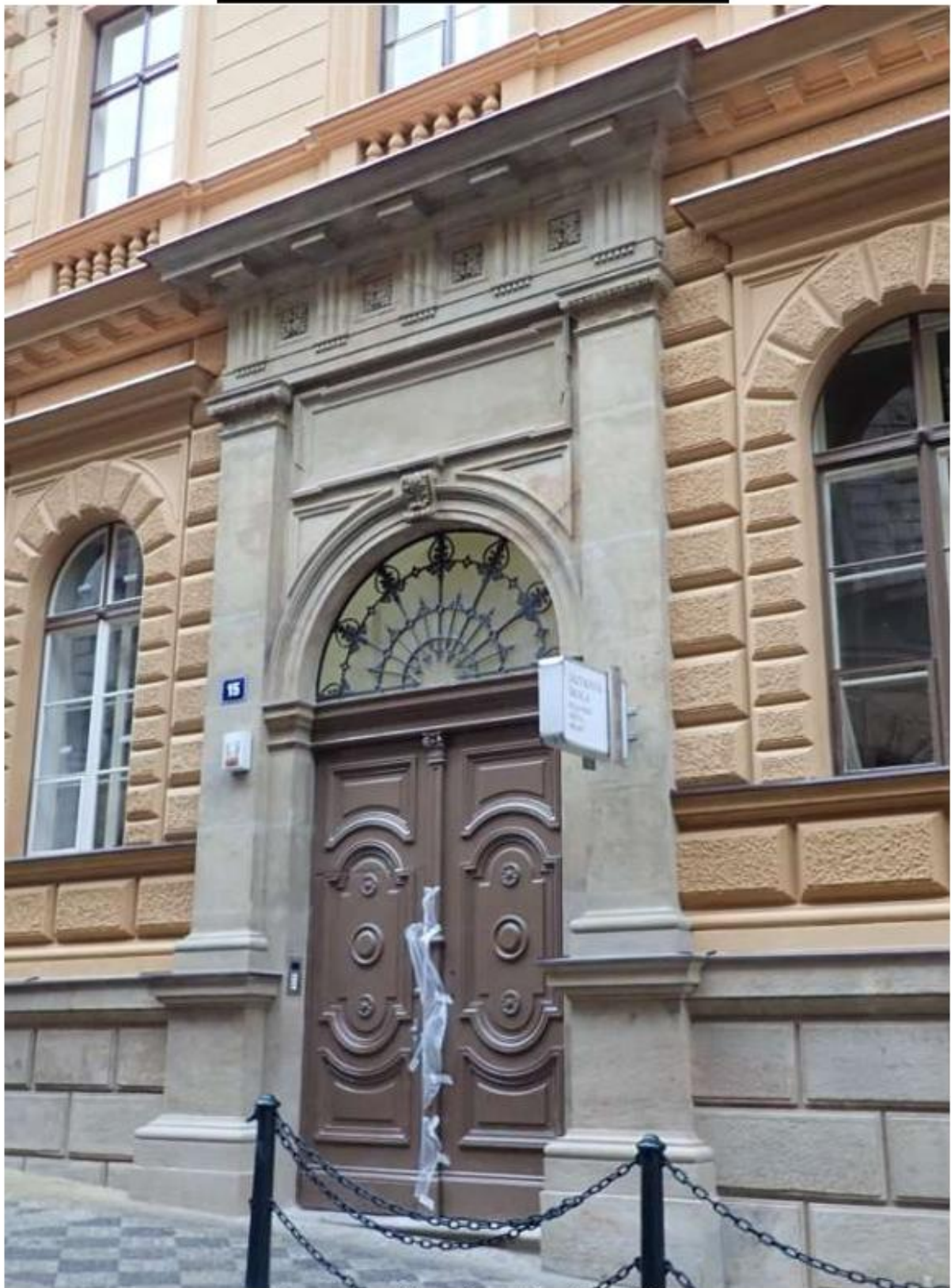
Vstupní portál po obnově ( v levé části ).