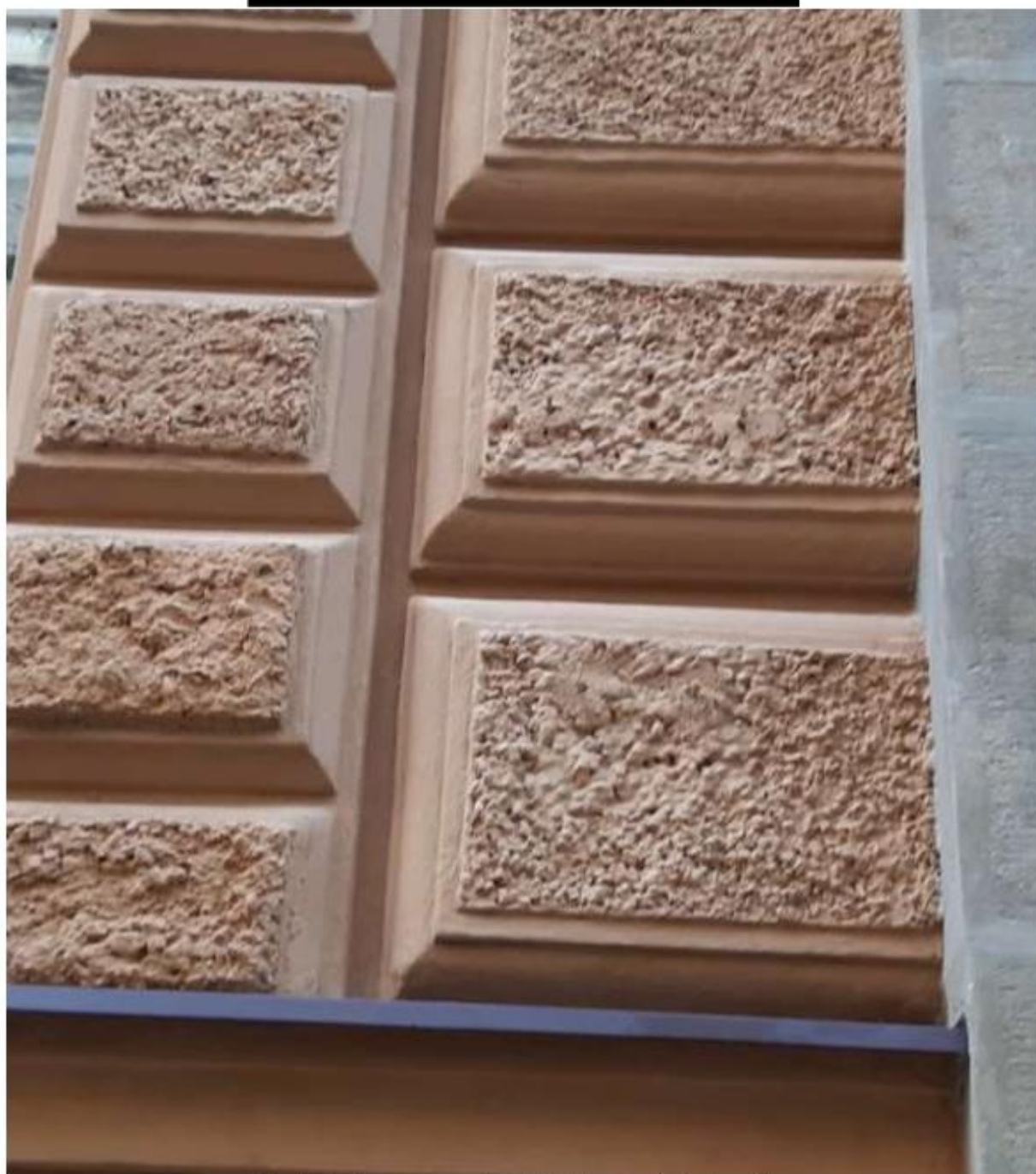
Nevhodná oprava a doplnění bosování u bosáže.