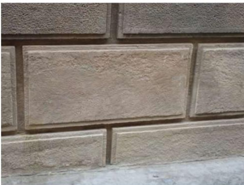
Oprava kamenných bosází, u kterých chybí kamenická úprava pemrlováním.