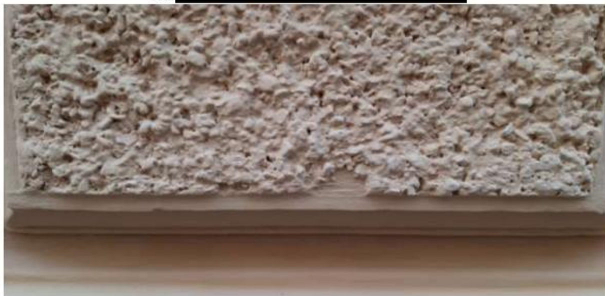
Vynechaná část bosování.