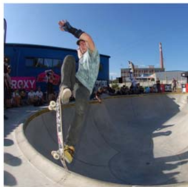
skatepark Veimez bowi od společnosti Mystic constructions