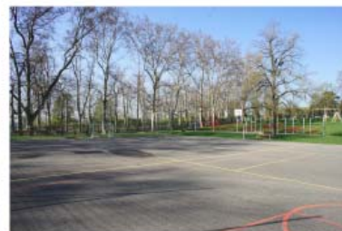
víceúčelové sportovní hřiště se sítí po obvodu