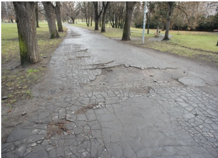
betonová a asfaltová cesta (1)