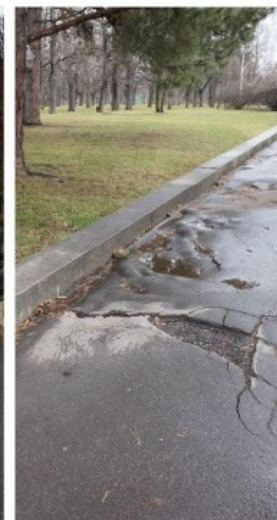
výtluky v asfaltovém chodníku (5)