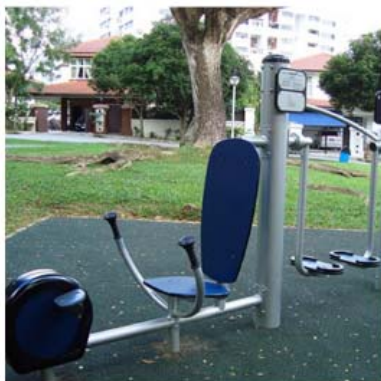
fitness stroje od společnosti Kompan