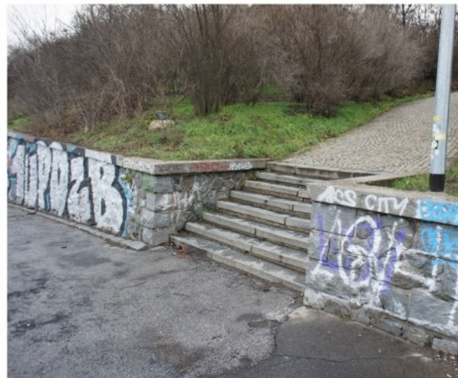
rekonstr. chodník/ opěrné zidky/ starý asfalt (2)