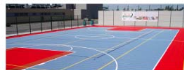
víceúčelové sportovní hřiště s povrchem z gumového granulátu