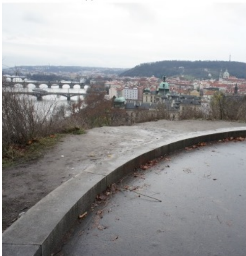
říslap nad svažitou částí sadů v místě rozhledu (3)