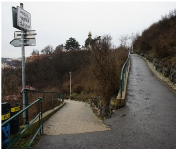
betonový a asfaltový povrch komunikace (4)