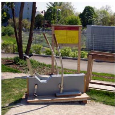
program zaměřený na seniory od společnosti Richter