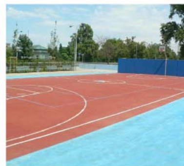
víceúčelové sportovní hřiště s povrchem z gumového granulátu