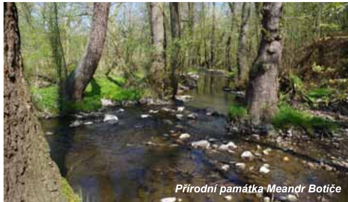
Přírodní památka Meandr Botiče

1. vydání. Neprodejně. ISBN 978-80-7647-075-0