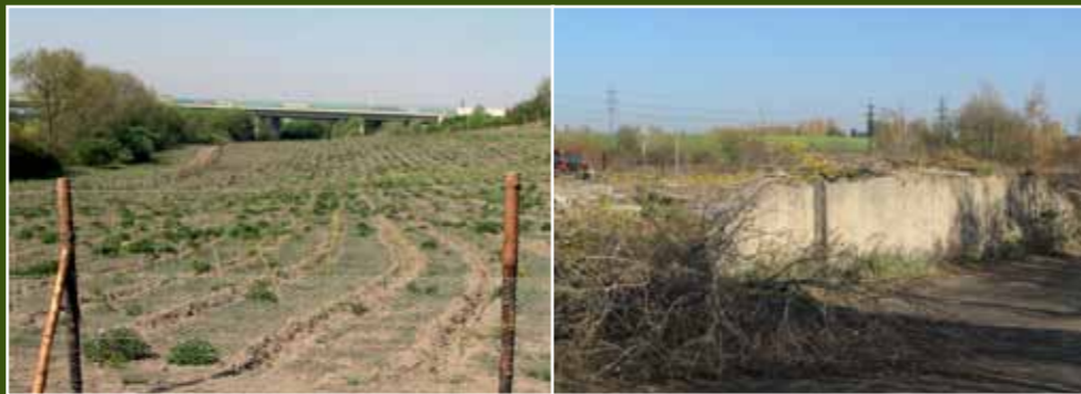
Nově vysázený les

Červeně je vyznačena hranice současného lesa v majetku hl. m. Prahy. Z mapy je patrné, že na území lesa se historicky nacházela pouze pole a louky.