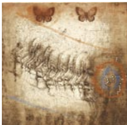
J. Anderle: 16 x dívka

Na aukci nebudou nabízena jen „velká plátna“, ale i malé a milé obrázky a plastiky v ceně od několika set korun, vhodné třeba jako vánoční dárek.