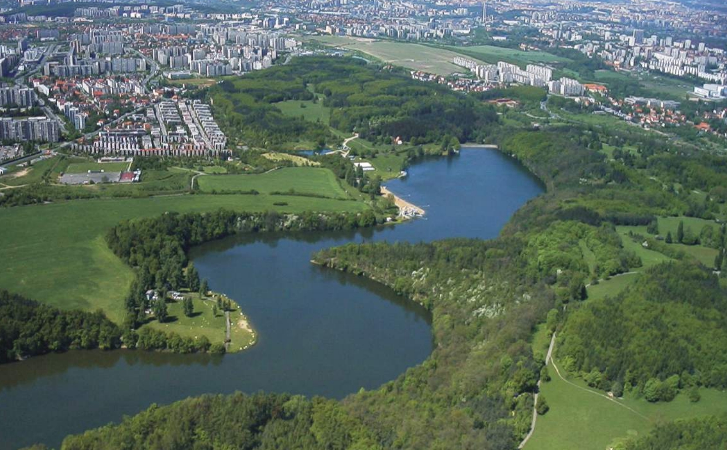
Vodní nádrž Hostivař od jihovýchodu

Jde o menší přírodní park, který dnes tvoří enklávu uvnitř velkoplošné městské zástavby. Pozůstává ze dvou částí. Horní zahrnuje oba svahy údolí potoka Botiče s přehradní nádrží Hostivař (dokončena v roce 1962) včetně zalesněných návrší po obou stranách a údolní nivu pod hrází nádrže až k okrajům staré Hostivaře. Úzký koridor, který touto obcí prochází při toku Botiče, propojuje horní úsek s dolní částí, která zahrnuje nivu Botiče a část zalesněného levého svahu údolí až k Hamerskému rybníku v Záběhlicích. Svahy údolí tvoří na horním okraji vodní nádrže břidlice a droby štěchovické skupiny neoproterozoika. Dále k západu jsou to horniny