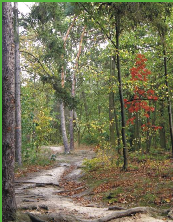
Bezprostřední okolí Hostivařské přehrady protíná řada cest a stezek, které Pražané využívají k různým sportovním aktivitám a odpočinku

Celý prostor ovšem trpí blízkostí městských čtvrtí i splachy z obce Hostivař, což podporuje ruderalizaci většiny stanovišť.