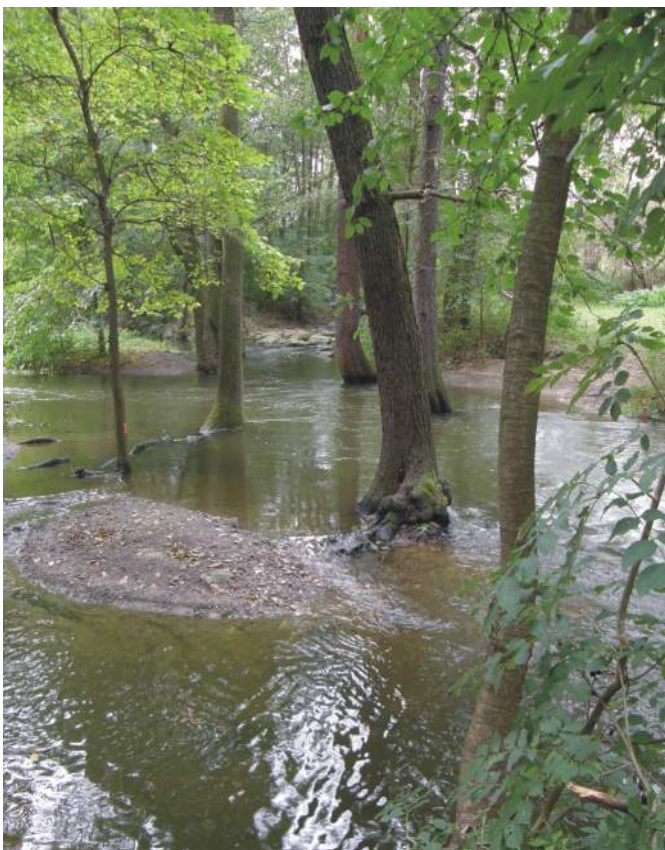
V přírodní památce Meandry Botiče je chráněn přirozený meandrovitý tok s břehovými porosty

Z přírodních hodnot má význam zejména tok Botiče s přirozenými meandry a pásy pobřežní vegetace. Tento úsek je dnes chráněn v přírodní památce Meandry Botiče. Břehové porosty tvoří nejčastěji vrba bílá ( Salix alba ), vrba košíkářská ( S. viminalis ), olše lepkavá ( Alnus glutinosa ), roztroušeně také jilm vaz ( Ulmus laevis ). Přirozený ráz má také lužní les a tůň pod Toulcovým dvorem s mokřadní entomofaunou.