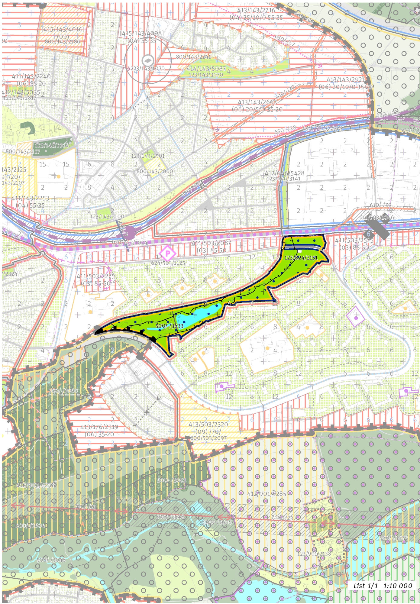
List 1/1 1:10 000